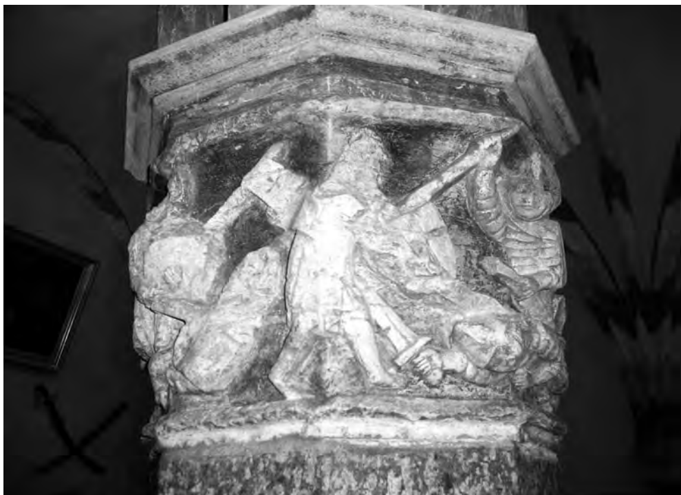
■ Štuková hlavice (Malbork, 14. stol.)

nika užití pomalu tuhnoucí sádry coby materiálu nahrazujícího kámen. Sádra je odlévána do bloků a zpracovávána běžnou technikou kamenických a řezbářských dílen, tj. dlátý a noží. Vzniká tzv. litý kámen, specifická technika užívaná především v zaalp-ských zemích. Podle rakouského badatele Manfreda Kollera, který se touto technikou podrobně zabývá, je objev litého kamene připisován salcburskému arcibiskupovi Thiemovi († 1110), což je ovšem jen pozdější legenda.