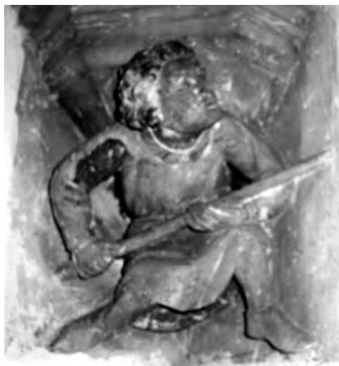
■ Štuková konzola (Malbork, 14. stol.)