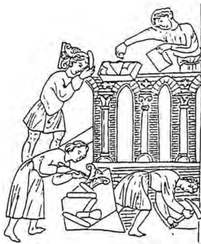
■ Opracování štukové hlavice nožem (vitraj v katedrále v Rouenu, kol 1220)