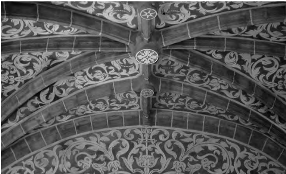
■ Sádrové sgrafito (Traiguere, Španělsko, 16. stol.)