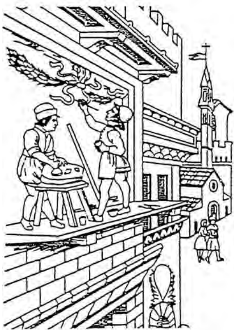
■ Štukatér a malíř (z florentského rukopisu, 15. stol.)

Tento posun byl způsoben především tím, že italská renesance přinesla podstatně zvýšené nároky na bydlení, projevující se bohatším vybavením profánních interiérů a jejich náročnější výzdobou. Štuk se začal uplatňovat i při výzdobě nábytku – zejména truhel (cassones) – k tomu účelu se sádra nehodila, protože byla příliš těžká a křehká. Začaly se používat různé masy, např. papírovina (cartapesta) nebo klihatřídové směsi, povrchově upravované zlacením či poly-