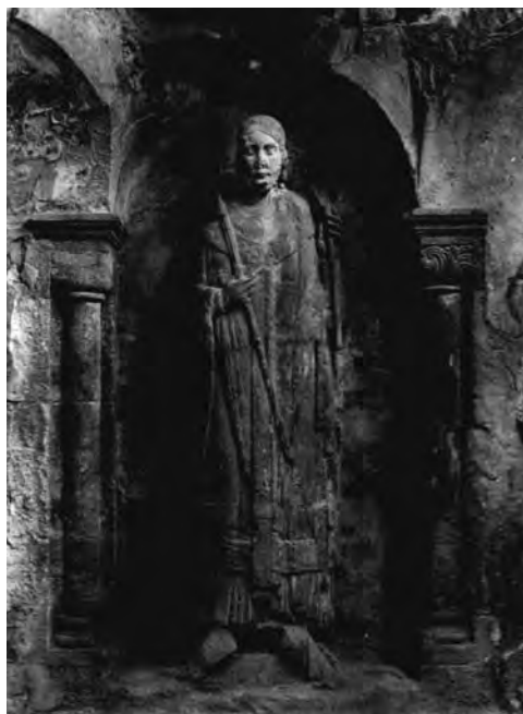
■ Plastika vytvořená řezbářským opracováním odlitého bloku (Gernrode, klášterní kostel, 12. stol.)