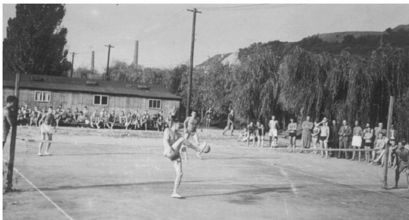
Obr. 3 Průkopníci na pražském turnaji Žluté lázně v roce 1942

Samotná podstata hry, kopání do míče a snaha o jeho udržení ve vzduchu, se podle historických pramenů objevuje ve světě již v době před naším letopočtem, a to převážně v Asii. Sport s názvem nohejbal vznikl v tehdejší Čkoslovensku. Už kolem roku 1922 se datují první zmínky o této hře, tehdy hrané přes natažený provaz. Jako mateřská města se uvádějí Praha a České Budějovice. Po roce 1936 zaznamenáváme první pravidelné tréninky a snahy o vytvoření prvních nohejbalových pravidel. Velký podíl na rozvoji této hry mají fotbalové kluby, které novou hru zařazují jako vhodný doplněk přípravy. V této době také vzniká název tohoto sportu, a sice nohejbal, přičemž vznik této složeniny je nepochybně inspirován slovem volejbal. Později se však uplatňuje i druhý název, fotbaltenis, dnes užívaný jako mezinárodní název tohoto sportu. Začíná éra osadních turnajů, jejichž tradice trvá dodnes. V roce 1944 jsou už vydána první jednotná pravidla. První, sice ještě neoficiální, avšak organizovanou dlouhodobou soutěž představuje Trampská liga družstev, hraná v letech 1953–61 na osadách v okolí Prahy. První oficiální nohejbalový orgán vzniká v roce 1961 ustavením pražské komise nohejbalu ČSTV a jejích soutěží. Brzy jej následují další okresy a kraje. V roce 1969 se konají první celorepublikové soutěže: Mistrovství ČSR a ČSSR. V roce 1971 je ustaven Český nohejbalový svaz, tehdy