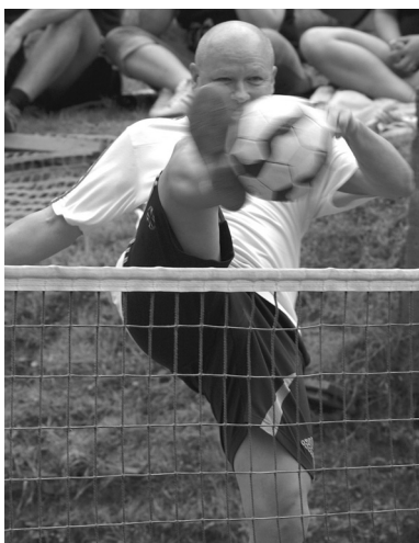
Obr. 1 Smečující fotbalový internacionál Ivan Hašek

Držíte v rukou knihu, která by měla podat vyvážené základní informace o sportu, mezi jehož další aktiva patří finanční nenáročnost v porovnání s jinými míčovými sporty, široké spektrum oficiálních i neoficiálních soutěží a v neposlední řadě i kamarádský duch jako dědictví raných tramských dob.