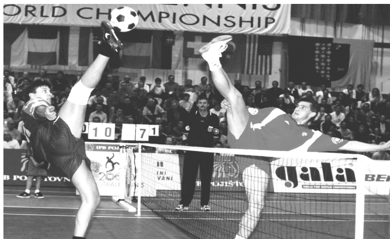
Obr. 4 Mistrovství světa mužů

jako např. v Německu, Itálii, Anglii, Norsku nebo Švédsku, ztratil své dřívější pozice. Na ostatních kontinentech je nohejbal rozšířen ještě v některých zemích Severní a Jižní Ameriky, Asie a Afriky. Pro další výraznější rozvoj tohoto sportu ve světě je nezbytná odborná spolupráce všech zemí na optimálním modelu pravidel (který zohlední tradici jednotlivých zemí a zároveň bude pro hráče, diváky i média atraktivní) a pro případnou realizaci olympijské myšlenky také kooperace všech forem příbuzných kolektivních her.